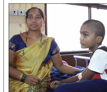
ಹುಬ್ಬಳ್ಳಿ: ಕಿತ್ತು ತಿನ್ನುವ ಬಡತನ ಒಂದೇ, ಮಗನಿಗೆ ಬಂದಿರೋ ಮಹಾಮಾರಿ ರೋಗ ಮತ್ತೊಂದೇ. ಖಾಸಗಿ ಆಸ್ಪತ್ರೆಗೆ ಕೊಡಲು ಲಕ್ಷ ಲಕ್ಷ ಹಣವಿಲ್ಲದ ಹೆತ್ತ ತಾಯಿ ತನ್ನ ಕಿವಿಯೋಲೆಯನ್ನೇ ಮಾರಿ ಮಗನನ್ನು ಆಸ್ಪತ್ರೆಗೆ ಕರೆದುಕೊಂಡು ಬಂದಿದ್ದಾರೆ.

ಈ ಪ್ರಕರಣಕ್ಕೆ ಸಂಬಂಧಿಸಿದಂತೆ ಸುಪ್ರೀಂಕೋರ್ಟ್ ಜಾಮೀನು ನಿರಾಕರಿಸಿರುವುದು ದರ್ಶನ್‌ಗೆ ದೊಡ್ಡ ಹಿನ್ನಡೆಯಾಗಿ ಪರಿಣಮಿಸಿದ್ದು, ಮುಂದಿನ ಕಾನೂನು ಹೋರಾಟದ ಮೇಲೆ ಅಭಿಮಾನಿಗಳ ಗಮನ ಸೆಟ್ಟಿದೆ.