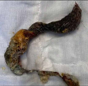
ಕೂದಲು ಮತ್ತು ಇತರ ವಸ್ತುಗಳನ್ನು ನುಂಗತೊಡಗಿತ್ತು. ಹೀಗೆ ನಿರಂತರವಾಗಿ ನುಂಗಿದ ಕೂದಲು ಮಗುವಿನ ಹೊಟ್ಟೆಯೊಳಗೆ ಸಂಗ್ರಹವಾಗಿ ನಿಧಾನವಾಗಿ ದೊಡ್ಡ ಗುಡ್ಡೆಯಾಗಿ ಮಾರ್ಪಟ್ಟಿತ್ತು. ವೈದ್ಯರ ಪ್ರಕಾರ, ಈ ಕೂದಲಿನ ರಾಶಿ ಹೊಟ್ಟೆಯಿಂದ ಆರಂಭವಾಗಿ ಸಣ್ಣ ಕರಳಿನವರೆಗೂ ಹರಡಿಕೊಂಡಿತ್ತು. ವೈದ್ಯಕೀಯ ಭಾಷೆಯಲ್ಲಿ ಇದನ್ನು "ರಬ್ಬರ್ ಜೆಲ್ ಸಿಂಡ್ರೋಮ್" ಎಂದು ಪರಿಣಿತ ವೈದ್ಯರ ತಂಡ ಲ್ಯಾಪರೋಸ್ಕೋಪಿಕ್ ಶಸ್ತ್ರಚಿಕಿತ್ಸೆಯ ಮೂಲಕ ಹೊರತೆಗೆಯಲಾಗಿದೆ.

ಬೆಂಗಳೂರು: ಸಿಲಿಕಾನ್ ಸಿಟಿಯ ಮೆಡಿಕಲ್ ಆಸ್ಪತ್ರೆಯ ವೈದ್ಯರು ಅತ್ಯಂತ ಅಪರೂಪದ ಮತ್ತು ಸಂಕೀರ್ಣ ಶಸ್ತ್ರಚಿಕಿತ್ಸೆಯನ್ನು ಯಶಸ್ವಿಯಾಗಿ ನಡೆಸುವ ಮೂಲಕ ಎರಡು ವರ್ಷದ ಪುಟ್ಟ ಮಗುವಿಗೆ ಮರುಜೀವ ನೀಡಿದ್ದಾರೆ. ಮಗುವಿನ ಹೊಟ್ಟೆಯೊಳಗೆ ಸಂಗ್ರಹವಾಗಿದ್ದ ಬರೋಬ್ಬರಿ 480 ಗ್ರಾಂ ತೂಕದ ಕೂದಲಿನ ದೊಡ್ಡ ಗುಡ್ಡೆ ಹಾಗೂ ರಬ್ಬರ್ ಬ್ಯಾಂಡ್‌ಗಳನ್ನು ಲ್ಯಾಪರೋಸ್ಕೋಪಿಕ್ ಶಸ್ತ್ರಚಿಕಿತ್ಸೆಯ ಮೂಲಕ ಸುರಕ್ಷಿತವಾಗಿ ಹೊರತೆಗೆಯಲಾಗಿದೆ.