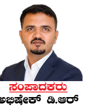
ಸಂಪಾದಕರು ಅಭಿಷೇಕ ಡಿ.ಆರ್