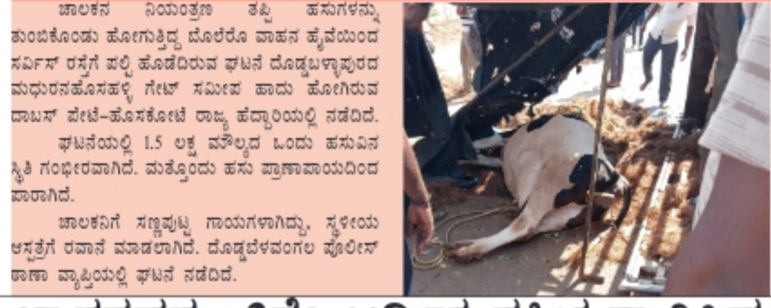
ಶಾಲಕನ ನಿಯಂತ್ರಣ ತಪ್ಪಿ ಹಸುಗಳನ್ನು ಕುರಿಕೊಂಡು ಹೋಗುತ್ತಿದ್ದ ದೊರೆಲಿ ವಾಹನ ಹೈವೆಯಿಂದ ಸರ್ವಿಸ್ ರಸ್ತೆಗೆ ಪಲ್ಟಿ ಹೊಡೆದಿರುವ ಘಟನೆ ದೊಡ್ಡಾಳುಬಳ್ಳಾರದ ಸಮುದ್ರವಹೋಪಕಲ್ಪ ಗೇಟ್ ಸಮೀಪ ಹಾಯ ಹೋಗಿರುವ ದಾಬ್ ಪೇಟೆ-ಹೊಸಕೋಟೆ ರಾಜ್ಯ ಹೆದ್ದಾರಿಯಲ್ಲಿ ನಡೆದಿದೆ.