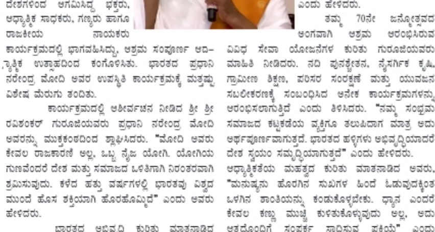
ಮನ್ನಣೆ ದೊರಕಲು ಪ್ರಧಾನಿ ಮೋದಿ ಅವರ ಪಾತ್ರವನ್ನು ಗುರುತಿಸುವುದು ವಿಶೇಷವಾಗಿ ಸ್ಪಷ್ಟವಾದ.