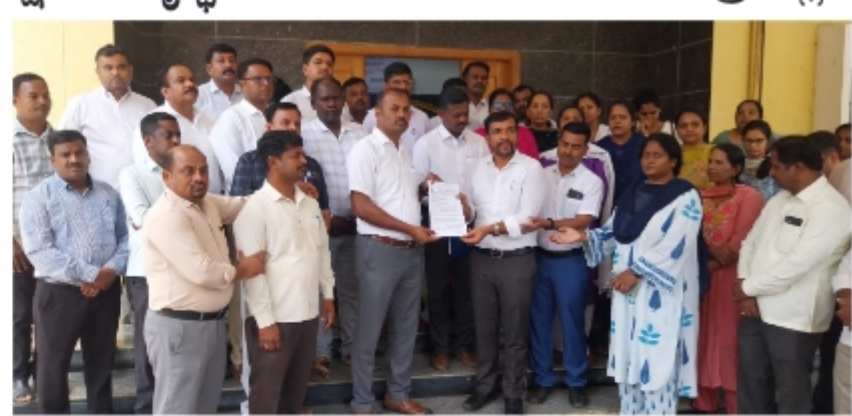
ದೇವನಹಳ್ಳಿ ಇತ್ತೀಚೆಗೆ ಗದಗ ಜಿಲ್ಲೆಯ ರೋಣ ತಾಲೂಕಿನಲ್ಲಿ ನಡೆದ ಟಿ.ಡಿ. ಮುಕ್ತಮಾಹಿಮೆ ಕರಡಿನಗುಡ್ಡ (46 ವರ್ಷ) ಅವರ ಅತ್ಯುತ್ತಮ ಪ್ರಕರಣ ಹಾಗೂ