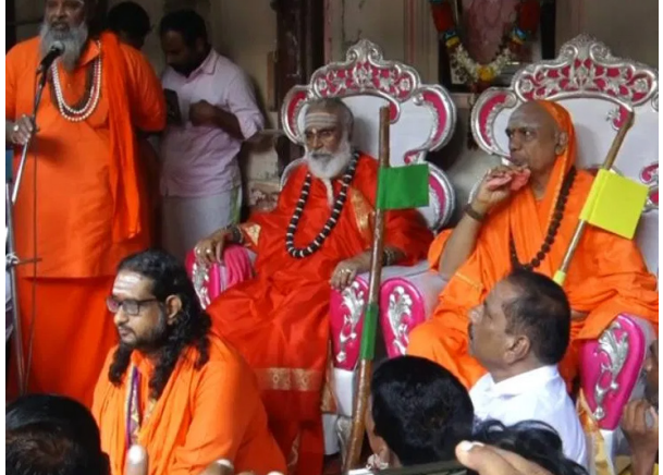
ಮಠದ ಆಸ್ತಿ ಮಾರಾಟಕ್ಕೆ ಭಕ್ತರ ವಿರೋಧ ಸಂಧಾನ ಸಭೆಯಲ್ಲಿ ಸ್ವಾಮೀಜಿ ಒಪ್ಪಿಗೆ

ಕುಂದಗೋಳ ಪಟ್ಟಣದಲ್ಲಿರುವ ಐತಿಹಾಸಿಕ ಹಾಗೂ ಧಾರ್ಮಿಕ ಮಹತ್ವ ಹೊಂದಿರುವ ಹಲವು ಪಂಚಗೃಹ ಹಿರೇಮಠದ ಆಸ್ತಿ ವಿಚಾರ ಕಳೆದ ಒಂದು ತಿಂಗಳಿಂದ ಭಾರೀ ವಿವಾದಕ್ಕೆ ಕಾರಣವಾಗಿದೆ. ಮಠದ ಒಡೆತನದ ಹಾಗೂ ಭಕ್ತರ ನಡುವೆ ಉಂಟಾಗಿದ್ದ ಈ ಭಿನ್ನಾಭಿಪ್ರಾಯ ಇದೀಗ ಪಂಚಗೃಹದ ಜಗದ್ಗುರುಗಳ ಮಧ್ಯಸ್ಥಿಕೆಯಿಂದ ಅಂತಿಮಗೊಂಡಿದೆ. ಮಠದ ಆಸ್ತಿಯನ್ನು ಸ್ವೀಕೃತ ಮಾಡಿ ಮಾರಾಟ ಮಾಡಲು ಮುಂದಾಗಿದ್ದ ಸ್ವಾಮೀಜಿಯ ನಿರ್ಧಾರಕ್ಕೆ ಭಕ್ತರು ತೀವ್ರ ವಿರೋಧ ವ್ಯಕ್ತಪಡಿಸಿದ್ದು ಹಿನ್ನೆಲೆ, ಇಂದು ನಡೆದ ಮಹತ್ವದ ಸಭೆಯಲ್ಲಿ ಸ್ವಾಮೀಜಿಗಳು ಇನ್ನು ಮುಂದೆ ಮಠದ ಯಾವುದೇ ಆಸ್ತಿ ಮಾರಾಟ ಮಾಡುವುದಿಲ್ಲ ಎಂದು ಲಿಖಿತ ಭರವಸೆ ನೀಡಿರುವುದು ವಿವಾದಕ್ಕೆ ತೆರೆ ಎಳೆದಂತಾಗಿದೆ. ಕುಂದಗೋಳ ಪಟ್ಟಣದ ಪಂಚಗೃಹ ಹಿರೇಮಠ ಈ ಭಾಗದ ಅತ್ಯಂತ ಹಳೆಯ ಹಾಗೂ ಪ್ರಸಿದ್ಧ ಮಠಗಳಲ್ಲಿ ಒಂದಾಗಿದೆ. ಅನೇಕ ದಶಕಗಳಿಂದ ಈ ಮಠ ಧಾರ್ಮಿಕ, ಸಾಮಾಜಿಕ ಹಾಗೂ ಸಾಂಸ್ಕೃತಿಕ ಚಟುವಟಿಕೆಗಳ ಮೂಲಕ ಸಾಮಾನ್ಯ ಭಕ್ತರ ಸಂಜ್ಞೆಯನ್ನು ನೀಡಿದ್ದು, ಮಠದ ಆಸ್ತಿ ಮಾರಾಟಕ್ಕೆ ಭಕ್ತರ ವಿರೋಧ ವ್ಯಕ್ತಪಡಿಸಿದ್ದರು. ಇದೇ ವೇಳೆ, ಮಠದ ಆಸ್ತಿ ಮಾರಾಟಕ್ಕೆ ವಿರೋಧ ವ್ಯಕ್ತಪಡಿಸಿದ ಭಕ್ತರ ವಿರುದ್ಧ ಸ್ವಾಮೀಜಿಯವರೂ ತಿರುಗೇಟು ನೀಡಿದ್ದರು.