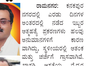
ಡಾಕ್ಟರ್ ಬಳಿಕ ನರ್ಸ್ ನೇಣಿಗೆ ಶರಣು: ಅಕ್ರಮ ಸಂಬಂಧ ಶಂಕೆಯಲ್ಲಿ ತನಿಖೆ

ನಗರದಲ್ಲಿ ಎರಡು ದಿನಗಳ ಅಂತರದಲ್ಲಿ ನಡೆದ ಇಬ್ಬರ ಅತ್ಯಹತ್ಯೆ ಪ್ರಕರಣಗಳು ಹಲವು ಅನುಮಾನಗಳಿಗೆ ಕಾರಣವಾಗಿದ್ದು, ಸ್ಥಳೀಯರಲ್ಲಿ ಆತಂಕ ಮತ್ತು ಚರ್ಚೆ ಗ್ರಾಸವಾಗಿದೆ. ಭಾಗಶಃ ಅಸ್ಪಷ್ಟವಾದ ವೈದ್ಯಕೀಕರಣ ಅತ್ಯಹತ್ಯೆಯ ಬೆನ್ನಲ್ಲೇ ಆದೇ ವರ್ಷಗಳಿಂದ ಕೆಲಸ ಮಾಡುತ್ತಿದ್ದ ನರ್ಸ್ ಸಹ ನೇಣು ಮಾಡಿಕೊಂಡು ಘಟನೆ ಇದೀಗ ಹೊಸ ತಿರುವು ಪಡೆದುಕೊಂಡಿದೆ. ಈ ಎರಡು ಸಾವುಗಳ ನಡುವಿನ ಸಂಬಂಧ ಬಗ್ಗೆ ಹಲವು ಪ್ರಶ್ನೆಗಳು ಉದ್ಭವವಾಗಿದ್ದು, ಪೋಲಿಸರು ವಿವಿಧ ಆಯಾಮಗಳಲ್ಲಿ ತನಿಖೆ ಆರಂಭಿಸಿದ್ದಾರೆ.