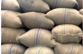
ಅಕ್ರಮ ಅಕ್ಕಿ ಸಾಗಾಣೆದಾರರಿಂದ ಹಣ ವಸೂಲಿ ಬಳಾರಿ ಎಸ್ ಪಿ ಗನ್‌ಮ್ಯಾನ್ ಬಂಧನ