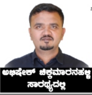
ಅಭಿವೇಶ್ ಬಿಲ್ವಮಾರನಹಳ್ಳಿ ಸಾರಥ್ಯದಲ್ಲಿ